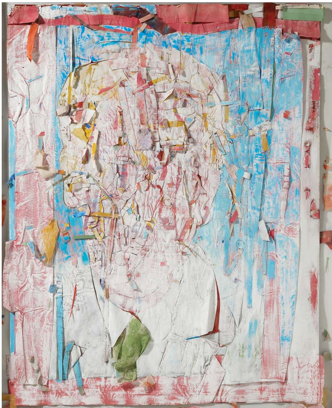
Ex -alguien. Técnica mixta sobre papel, 115 x 90 cm