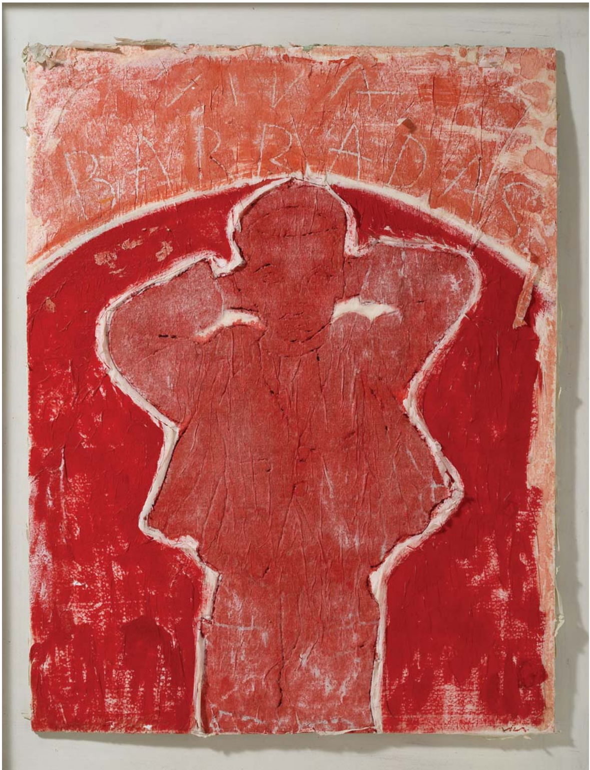
Viva Barradas. Técnica mixta sobre tergopol, 104 x 82 cm