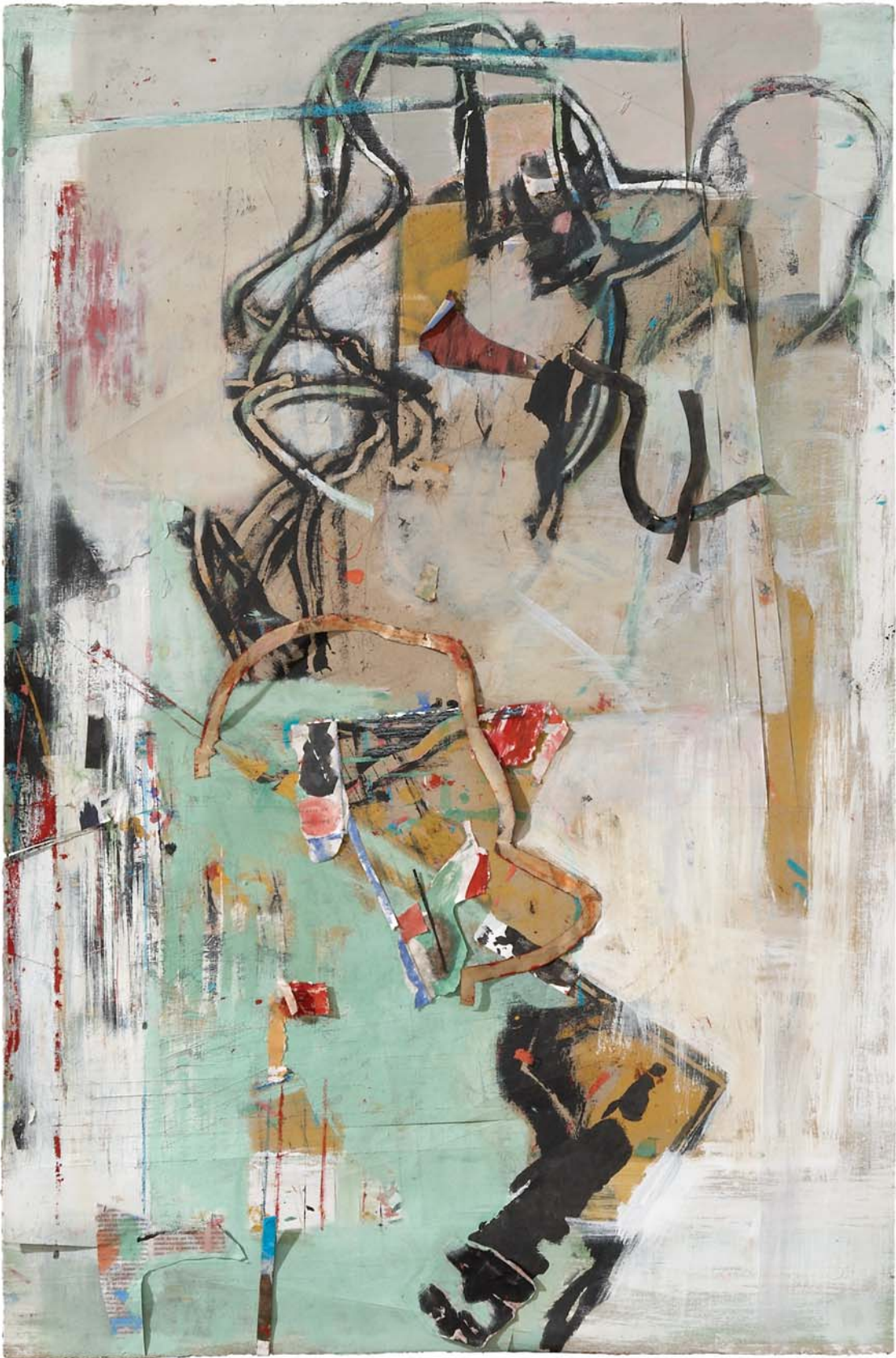
Los sombreros de Gardel. Técnica mixta sobre papel, 107 x 69 cm