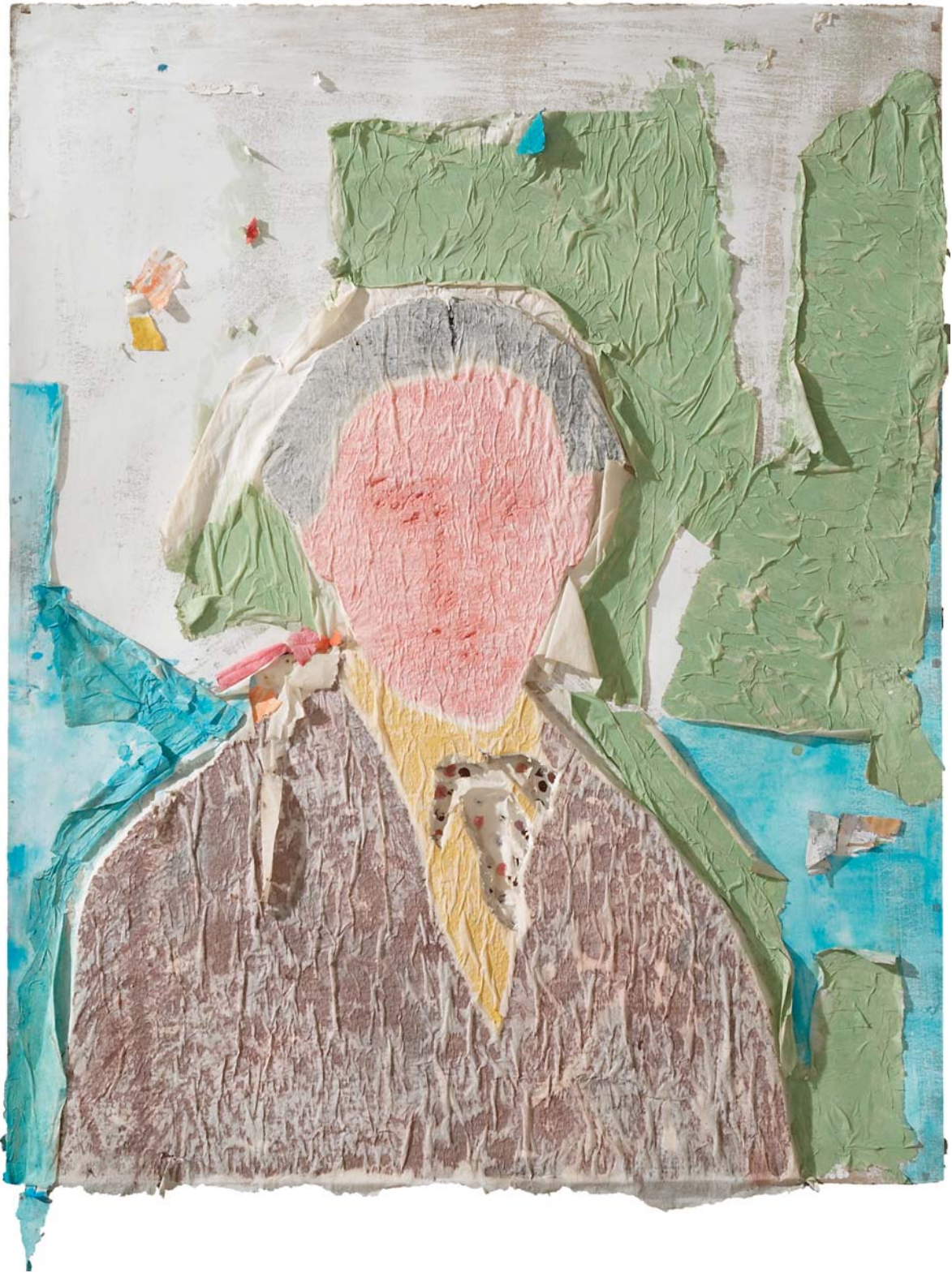
De Simone. Técnica mixta sobre tergopol, 106 x 84 cm