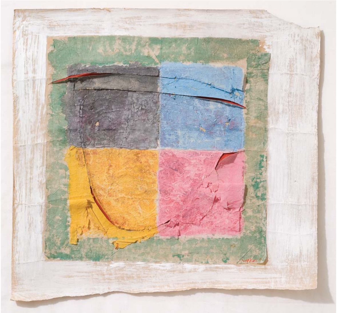
Personaje en cuatro tiempos. Técnica mixta sobre papel, 43 x 41 cm