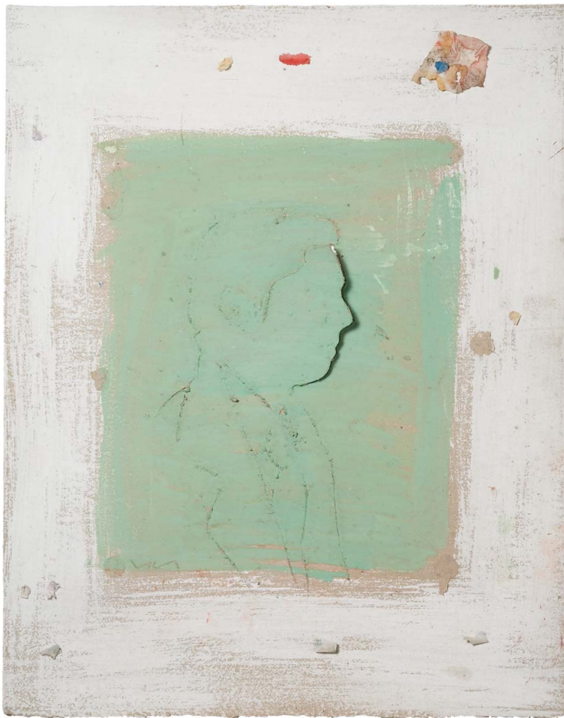
Perfil Verde. Técnica mixta sobre papel, 53,5 x 42 cm