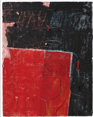
Mateo Rojo y Negro. Técnica mixta sobre tergopol, 107 x 84 cm