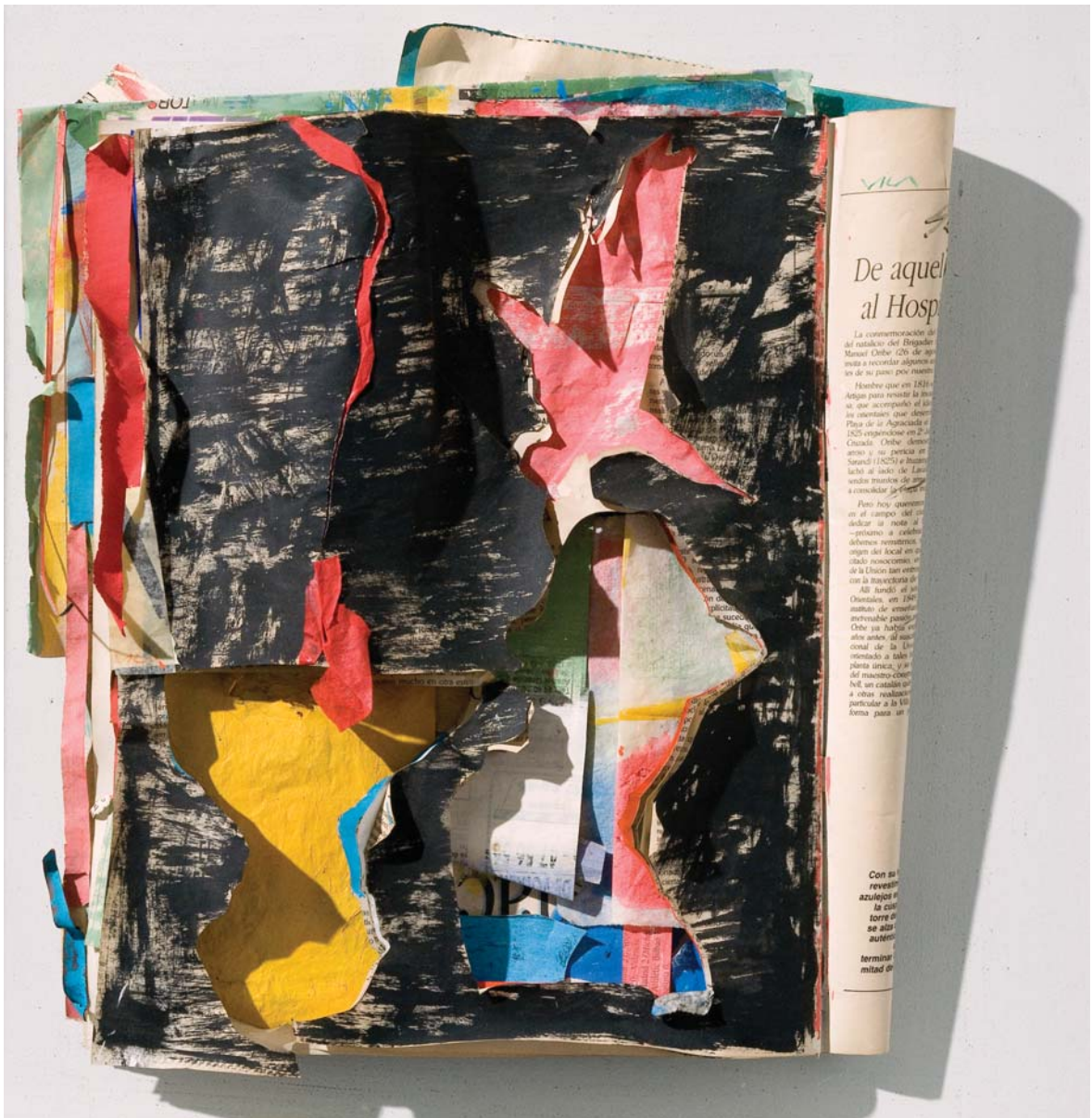
Línea de tres. Técnica mixta sobre papel, 40 x 34 cm