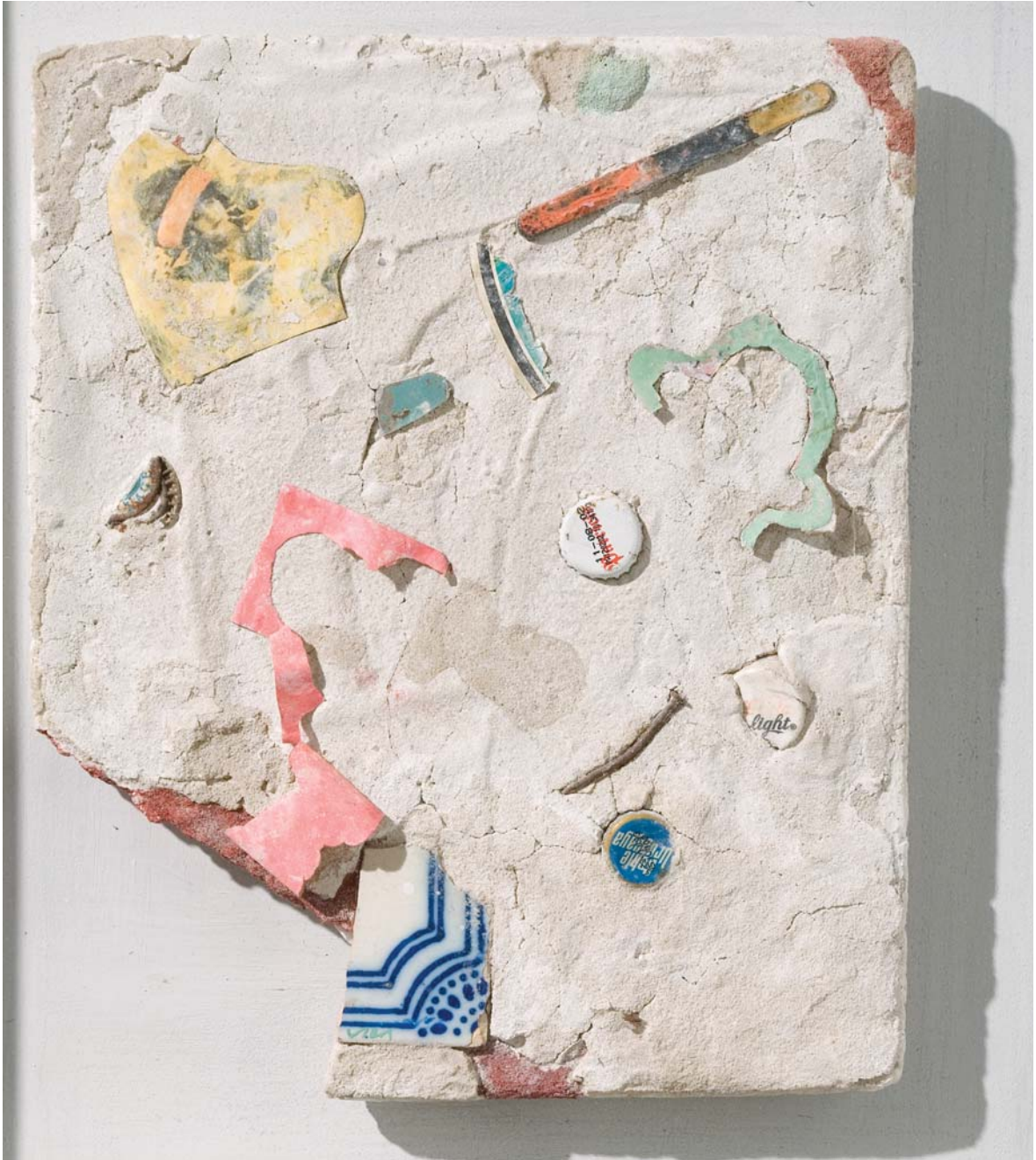
Imagen-ex. Técnica mixta sobre tergopol, 35 x 29 cm