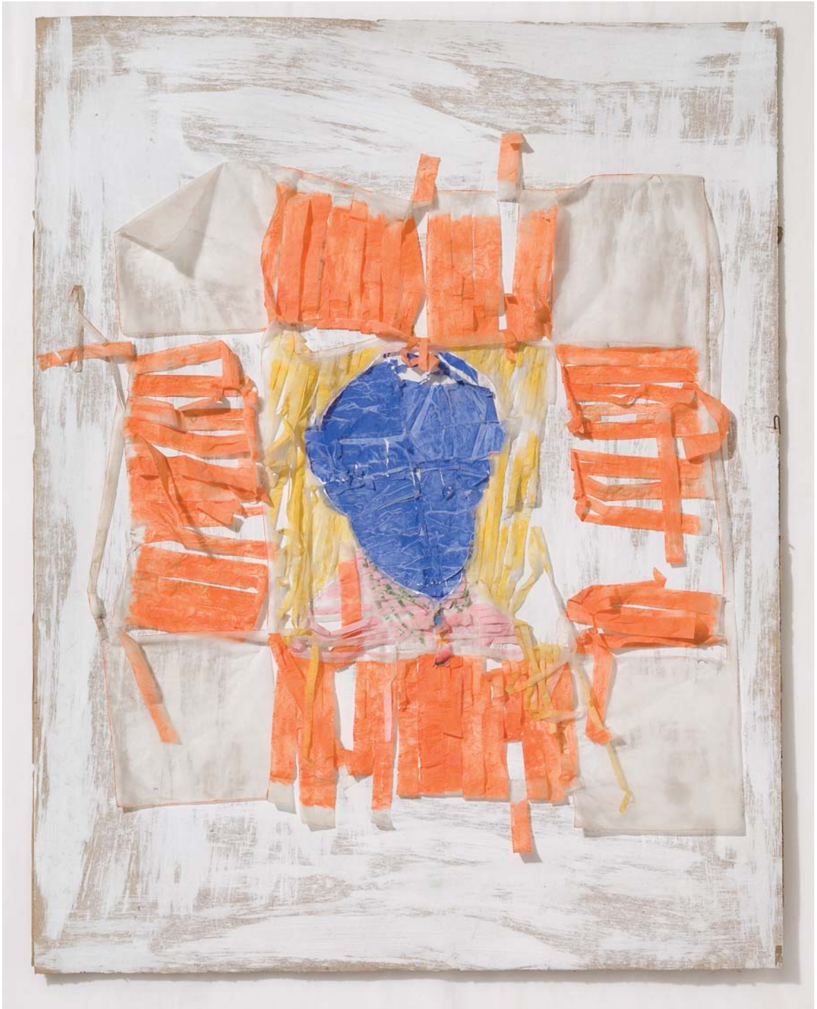
Retrato Cometa. Técnica mixta sobre papel, 107 x 84 cm